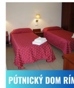
PŮTNICKÝ DOM RÍM